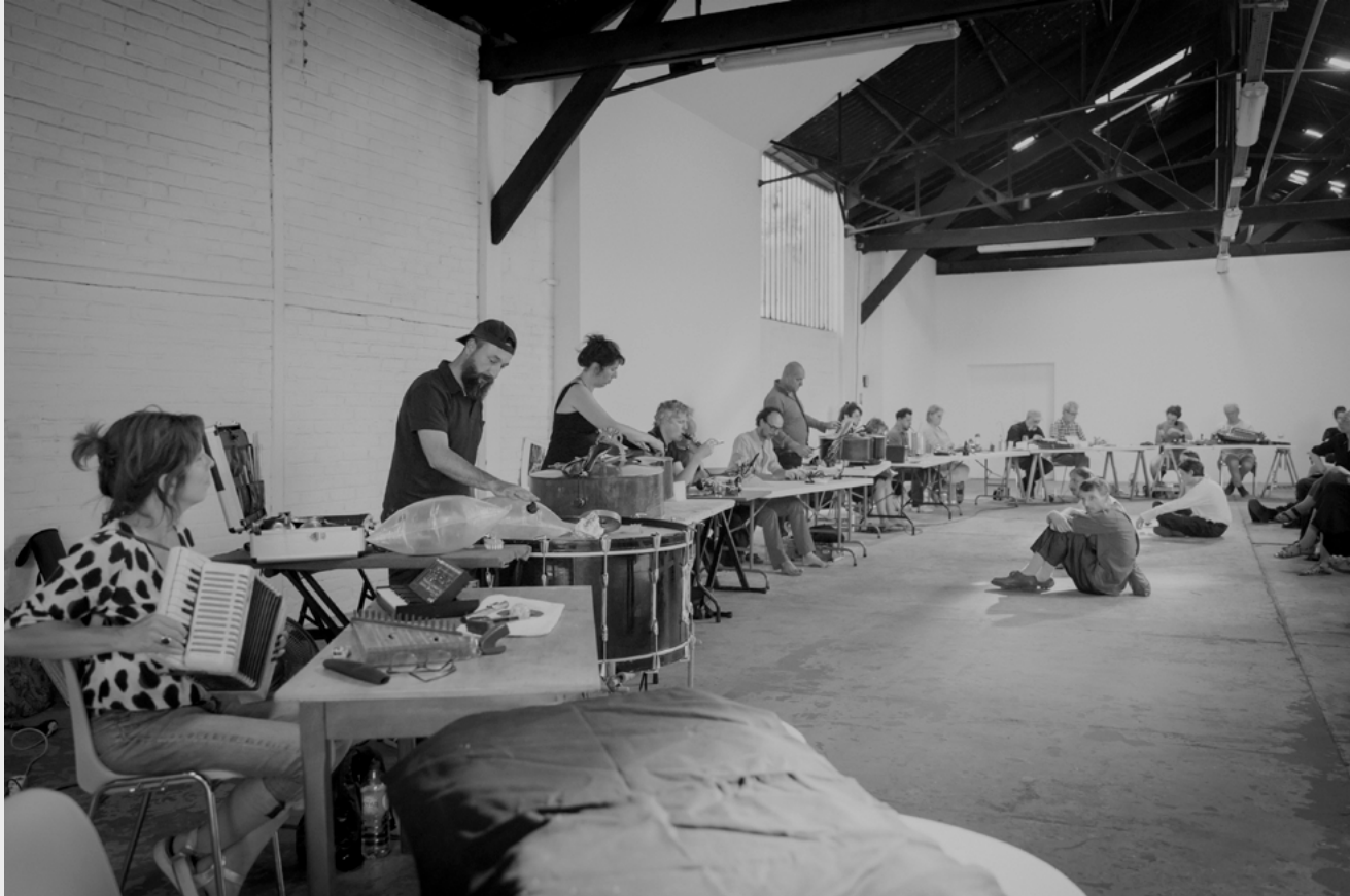
Le UN, "Espace tendu", 10 juillet 2022